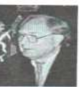
IZU GOTT - dirijor. - mozaic. - conductor. - Jewish.